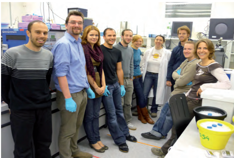
Die unermüdbaren Schwerarbeiter des dynamischen multiomics Experimentes («BIG Y»).

erklärt Uwe Sauer. Wenn die Forscher in absehbarer Zukunft also im Detail wissen, wie eine Hefezelle den Zuckergehalt in der Umgebung misst und mit der Alkoholproduktion darauf reagiert, wird dies nicht nur für Bierbrauer interessant sein.